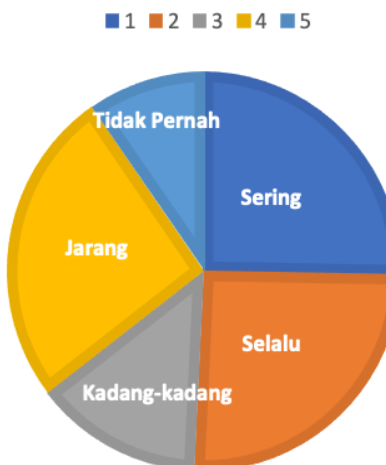
Gambar 4. Grafik Persentase Kemudahan Penggunaan PMM.

Pada indikator Kemudahan Penggunaan Platform Merdeka Mengajar terlihat pada poin yang cukup tinggi pada pernyataan Sering sebesar 27% dengan nilai 136. Responden merasa terbantuan dengan dukungan ataupun bantuan berupa panduan ataupun dari pengawas, kepala sekolah, maupun sesama guru dalam memahami aplikasi Platform Merdeka Mengajar . Hal ini memperlihatkan kondisi teman sejawat pada sekolah tempat bertugas akan sangat mempengaruhi keinginan guru sebagai tenaga pendidik untuk mencoba menggunakan aplikasi Platform Merdeka Mengajar yang diluncurkan oleh Kemendikbudristek.