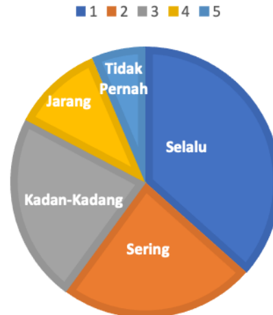
Gambar 5. Grafik Persentase Kemudahan Penggunaan PMM

Indikator Kecepatan Penggunaan Platform Merdeka Mengajar tergambar pada nilai negatif dengan persentase sebesar 24% yang secara signifikan tertinggi pada pernyataan Jarang sebesar 118 poin. Responden belum merasakan manfaat dan memaksimalkan peluncuran aplikasi Platform Merdeka Mengajar untuk dapat membantu guru sebagai tenaga pendidik dalam menyelesaikan administrasi pembelajaran Kurikulum Merdeka dengan cepat ataupun dalam hal memuat data yang dicari dalam menunjang implementasi Kurikulum Merdeka dengan cepat.