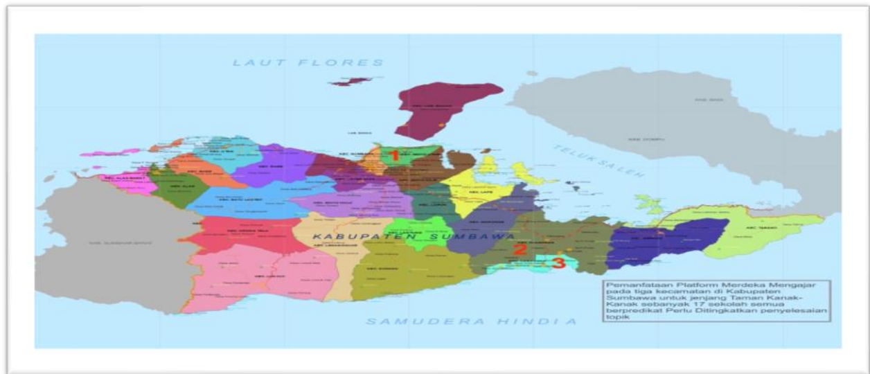
Gambar 1. Pemanfaatan Platform Merdeka Mengajar pada di Kabupaten Sumbawa.

Penelitian ini dilaksanakan dengan mengambil populasi 50 guru taman kanak-kanak di 17 sekolah pada Kecamatan Moyo Utara, Kecamatan Labangka dan Kecamatan Plampang dengan waktu pelaksanaan pada bulan Juli sampai dengan bulan Oktober 2023.